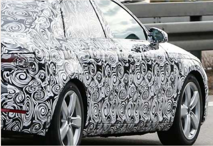
Erbkönige sind Prototypen der Automobilbranche