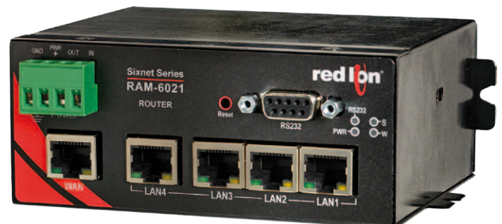
Bild 2: Robuster Industrierouter zur sicheren Datenübergabe in die Cloud.

Zeit ist Geld - vor allem in der Industrie. Deshalb müssen sowohl Servicemitarbeiter als auch Betriebsleiter jederzeit auf Maschinen und Anlagen eines Herstellungsprozesses zugreifen können - unabhängig von ihrem Standort. Was ist zu tun, wenn es darum geht, diverse Maschinen und Anlagen, intelligent miteinander zu vernetzen? Im Besonderen dann, wenn es sich um Bestandsanlagen- und -maschinen handelt?