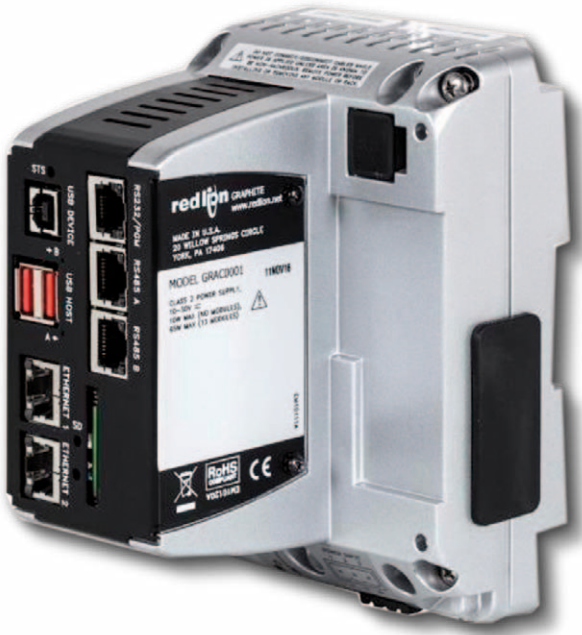
Bild 1: Protokollkonvertierer, der mehr als 300 industrielle Protokolle unterstützt, um verschiedenartige Geräte nahtlos miteinander kommunizieren zu lassen.

Datenpunktspiegelung in der Cloud ermöglicht permanent Remote-Monitoring und -Controlling